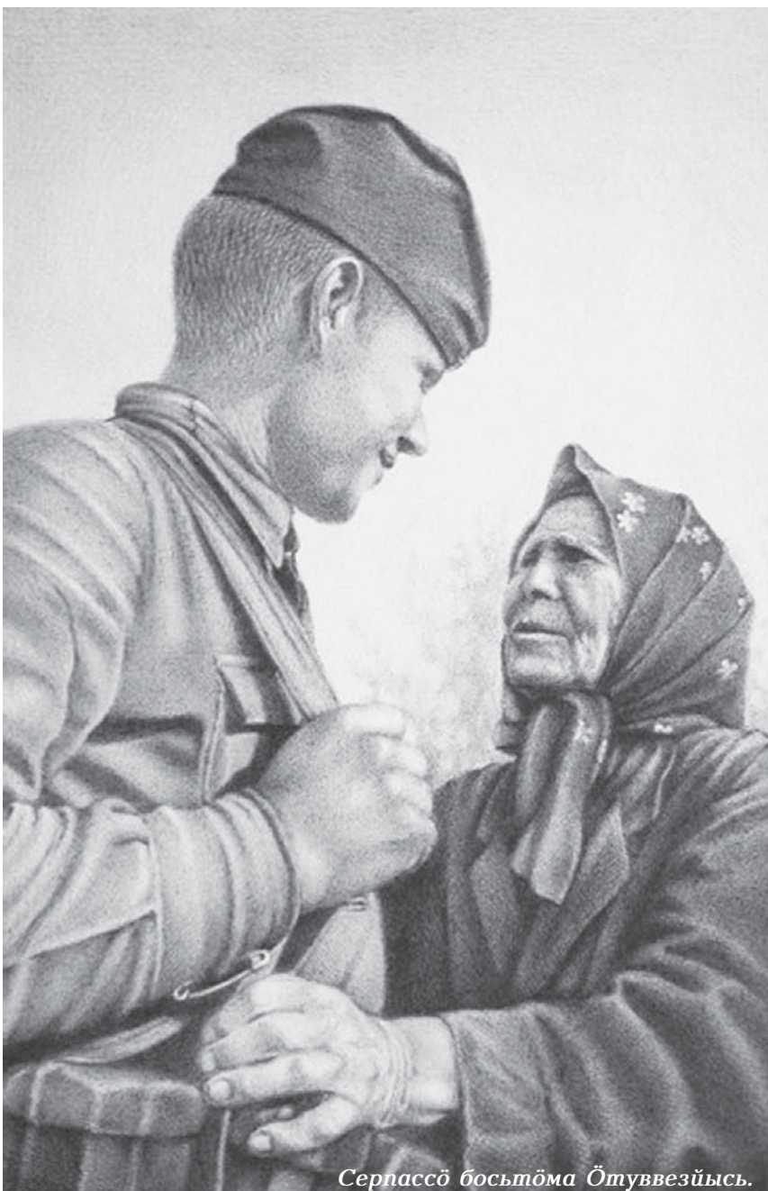
СерпасӖ босьтӖма Ӗтуввезйысь.

ТӓнӖ аддзылі ме талун вӖтӖн. СьӖкыд веритны ассьым шуд — Степяс вомӖн, сраженъеяс вомӖн БыттӖ мелань корсин туй.