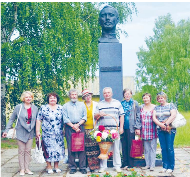
Гижысьяс Куратов сиктын 2014 во.

2015-од восö Россияын шуöма литература воон. Литератураныс гөгөрвосьö зэв паськыда — тайö миян классикъясон лосьöдöм гижöдъяс, тайö öния гижöдъяс: висыгыяс, повесыгыяс, мойдыяс, кывбурьяс, сыланкывьяс, пьесаяс, казтыломъяс да с.в. Литература сөвмö быд лун, и гижысьяс пуктöны ассыныс сямлунсö, сьöломкылöмсö, енбиалунсö, мед эськö сьöлом да вежөр пыр лэдзöм гижöдъясныс лоины матыссаось да донаось лыддысьысылы, кодi вермас босьтны наысь мыйкö зэв коланаос.